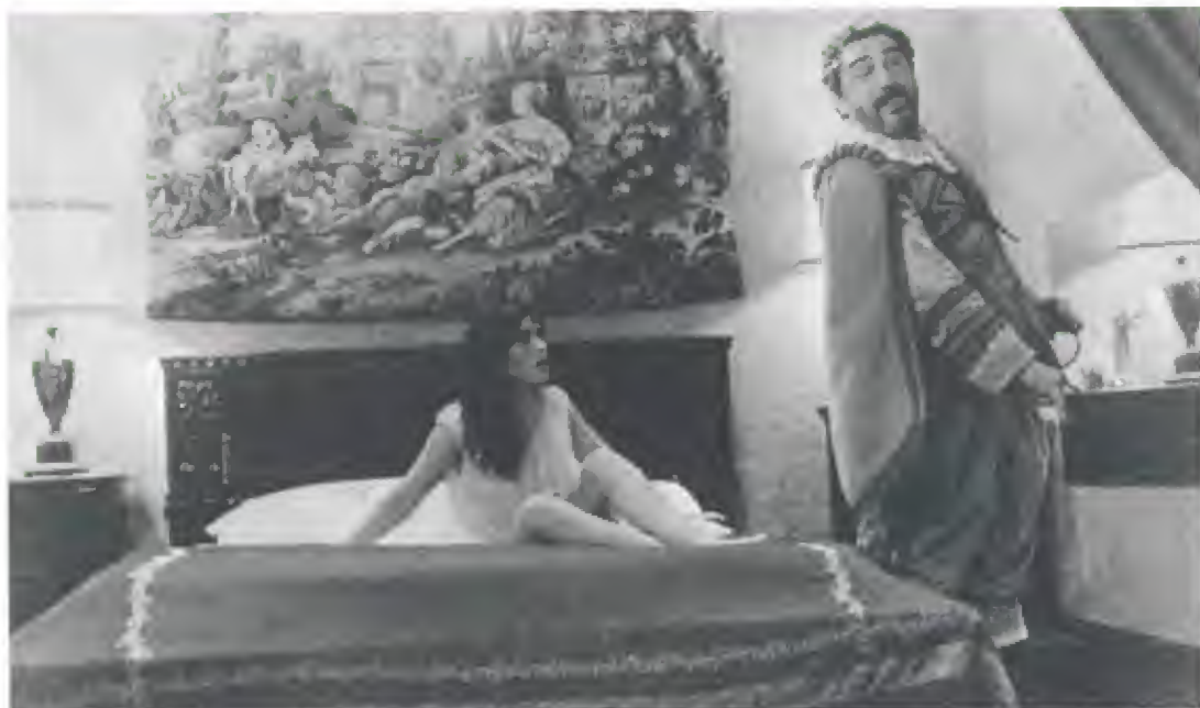
Lilli Carati - Renzo Montagnani